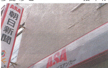
「全国約1万7000カ所の新聞販売所が管理サービスの拠点になるかもしれない」

「エリアで継続してサービスができるのが目標。事業全体で数年のうちに黒字化を目指す」(同社担当者) 「夜が明けぬうち聞かえてくる新聞配達員の足音を誰しも一度は聞いたことがあるだろう。」 福岡では、ヤクルトレディが高齢者の見守りに一役買っている。地場大手の三好不動産(福岡市)が作ったNPO法人介護 年配者を見守り ヤクルトレディ活躍